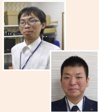
<近年中途採用された社員の方々>

参加者側から応募を辞退されることもあるが、インターンシップは双方に納得した上で入社・採用を判断する機会なのではないかと考えている。