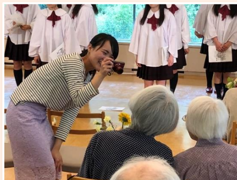
<居住者の方と一緒に合唱会へ参加>

職場体験により、法人側も参加者側も相互に理解が深まっていると感じている。実務を見たり体験することで、仕事への興味がより深くなるほか、本人の不安や悩みなどもある程度解消できるため、本人が納得した上で就職していただくための良い機会になっていると考えている。また、職員も、参加者に教える側に立つことで新たな気づきが得られ、成長に繋がっている。