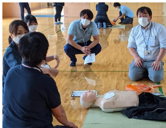
<職員研修での救命講習>

直近5年間の中途採用者12名のうち、9名は就職氷河期世代（35歳～49歳）に該当し、うち4名は前職が美容関係や整体師などの業界未経験者であった。新型コロナウイルス感染症の影響で前職（サービス系の職種）が不安定になってしまった未経験者の採用も行った。