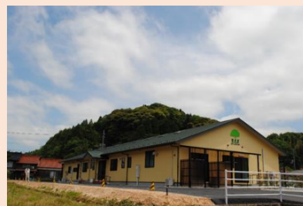
<法人グループホーム外観>