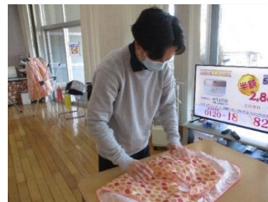
<業務にあたる従業員の方>

今は、子育て世代の方などを意識し、法人内での保育所と連携するなど、働きやすい、休みを取りやすい環境づくりを心掛けている。