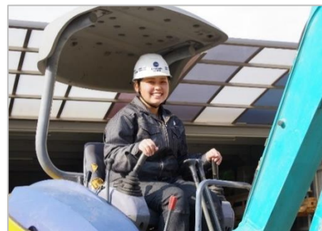
<近年中途採用された方>

育成に関しては、 幹部従業員がマンツーマン で行う。職種は、「工事スタッフ」「アドバイザー」「デザイナー」の3つを設けているが、社内の結束を高め、従業員同士の感謝し合う風土を醸成するために、 お互いの仕事を体験するジョブローテーション を行っている。