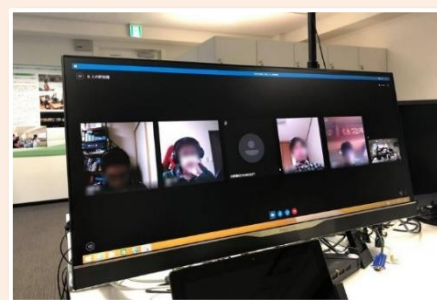
<テレワークインターンシップの様子>

さらに、インターンシップを通じて、教える側にも新しい学びがあることや、社会人インターンシップを実施した場合のほうがり着率が高いことも、メリットと考えている。