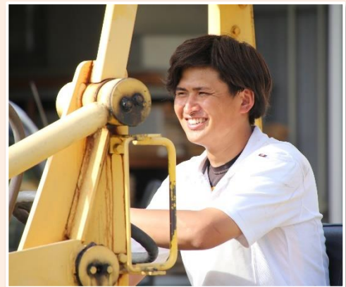
<近年中途採用された方>

職場体験後、採用面接に進むかは本人の希望次第だが、職場体験を実施することは、改めてこの会社で働きたいと思うかを判断することができる良い機会だと考えている。また、従業員と応募者が関わる時間が増え、職場の雰囲気が悪くなったとも感じている。加えて、採用後の定着率やその後の本人の成長、社内の雰囲気という点から見ても、職場体験の取組は大成功していると考えている。