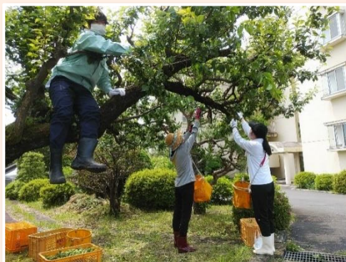
<敷地内の梅の収穫の様子>