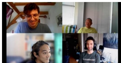
<フランスからのインターンシップ参加者の様子>

このような働き方を推進するには、従業員と一緒に生産性を上げる必要があり、経営層が変わらないといけない。 遊ぶ時間がないとイマジネーション力は上がらないし 、そういう楽しい雰囲気が伝わらないと、若い方が入らないと考えている。