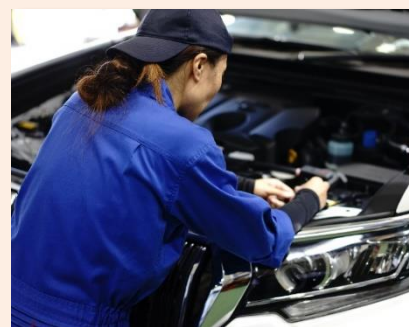
<近年採用された元営業職の社員>

社会人インターンシップは、面接より把握できることが多く、応募者の仕事に対する考え等も丁寧に聞くことができる。まだ開始して2年程だが、互いに納得しての入社となるため、採用のミスマッチは防げていると考えている。