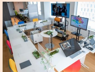
<各所とWebで繋がるオフィスの様子>

「遊び心とイマジネーション」 完全テレワークによるインターンシップと 個性を発揮できる組織づくり