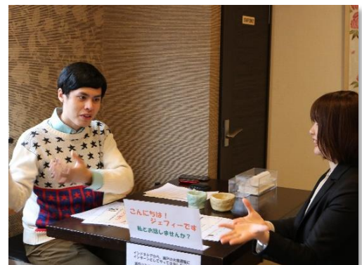
<インドネシアからのインターンシップ参加者の様子>

また、人材育成の一環として、資格取得に関するものや仕事に関連する図書等の費用を負担している。