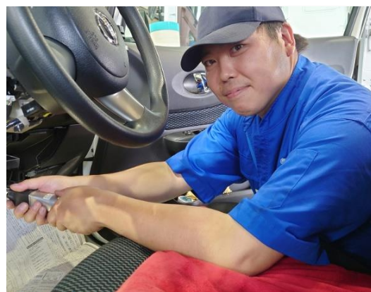
<近年採用された中途採用の社員>

教育制度については、徐々に導入しはじめているところであり、資格取得支援として、試験の費用などを負担している。また、現在は スキルの「見える化」 を検討し、試行している。