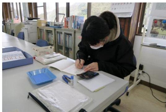
<2021年12月採用の従業員の様子>

なお、従前の雇用形態を見直し、現在は、 原則として全員正規職員として雇用 している（本人の希望に応じ、パートタイム契約にするなど、柔軟に対応している）。