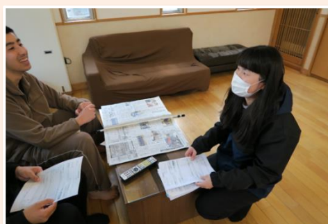
<2021年12月に採用した従業員の様子>