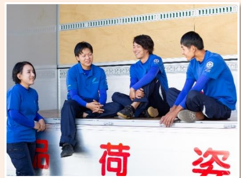
<日頃からコミュニケーションをよくとるスタッフの様子>

実際、社会人インターンシップの参加者のうち半分程度が採用されており、社会人インターンシップ参加者の採用の割合が高くなっている。また、社会人インターンシップを実施することで、従業員の参加者への接し方、伝え方を考える機会が生まれるため、従業員の成長にも繋がる良い機会だと考えている。