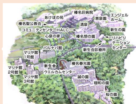
<社会福祉法人新生会 全景>