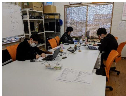
<1Dayインターンシップの様子>

採用後の制度として、「自己啓発手当」の制度がある。入社半年後を目安に、ITスキルを身につけてもらうための制度で、書籍の購入等の自己啓発に対して手当を設けている。