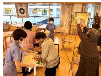
<居住者の方と小正月の準備>

採用後は、法人全体の研修として3月下旬に2泊3日で宿泊研修を行い、当法人の沿革説明や施設見学、高齢者の心理とケア、高齢者のケアワーク、安全衛生学等の座学、そして実際の現場でのワークを行った上でふりかえりを行う。また、1ヶ月実際の業務を行った上で、5月に1日間のフォローアップ研修を行っており、看護師や栄養士による座学、施設長とソーシャルワーカーとのグループディスカッション、ふりかえりを通して、不安や悩みを共有、解消を図っている。その他に、配属された施設ごとに研修を行っている。